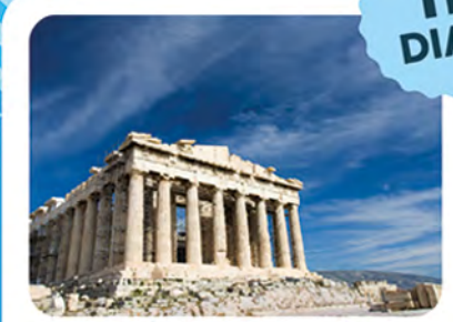
Grécia, Turquia e Itália