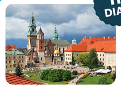
Polónia, Hungria e República Tcheca